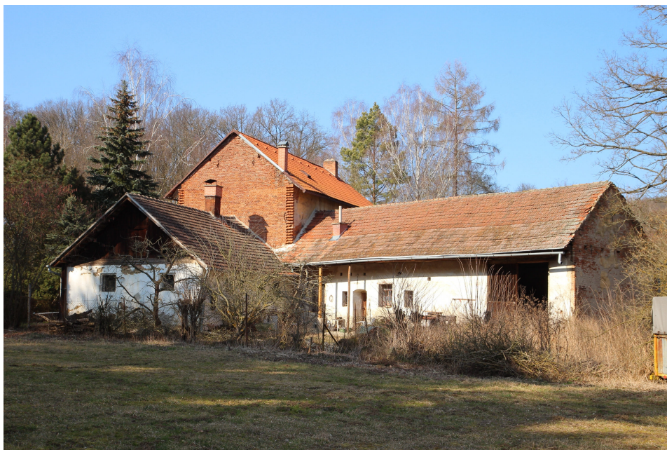
Předjaří na Spáleném mlýně na Bobravě První písemná zmínka o Spáleném mlýně je z roku 1378