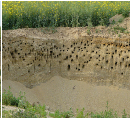
Stav v roce 2008