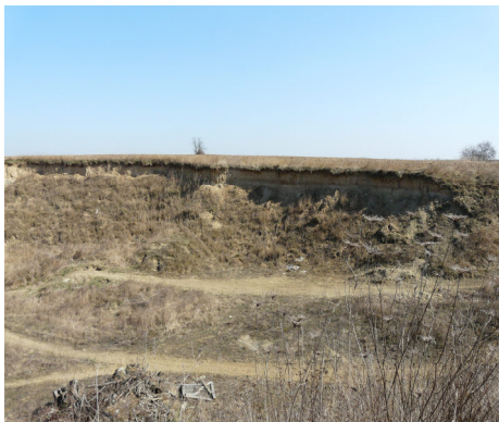
Stav v roce 2013

Postupem času břehule zákonitě ztratily o pískovnu zájem. Stěna byla prodolována starými norami, docházelo k částečným sesuvům stěn, k jejich zešíkmení (břehule vyžadují kolmé stěny) a zarůstání trávou a plevellem. Břehule si našly nová hnízdiště, s největší pravděpodobností v bratčické pískovně.