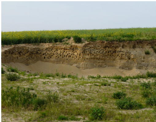
Stav v roce 2008

Tento osud potkal i naši pískovnu. Ještě v letech 2008 a 2009 bylo možno napočítat cca 500 hnízdních nor, z nichž odhadem čtvrtina byla osídlených.