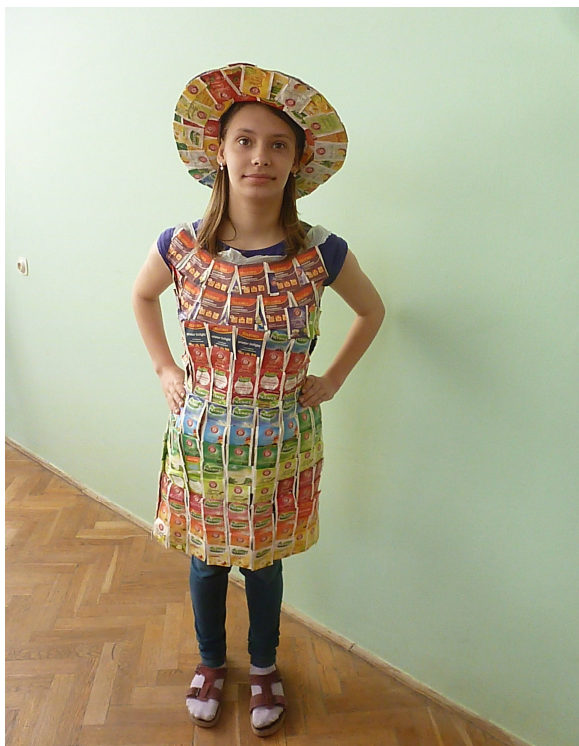
Šaty a klobouk z papírových obalů na čajové sáčky